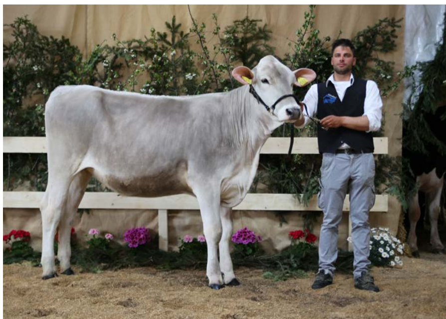
Riserva delle manze brune