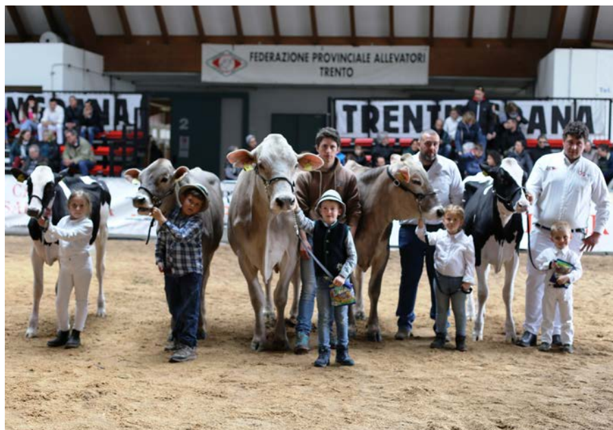
I baby protagonisti della gara di conduzione

La gara di conduzione è altrettanto interessante sia vista dai ragazzi che "combattono" fra di loro per emergere, sia per il pubblico che vede in tutti questi giovani e giovanissimi la passione che gli allevatori hanno per il proprio lavoro e per i propri animali.