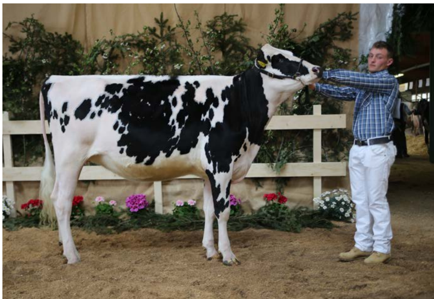
Campionessa delle manze frisone