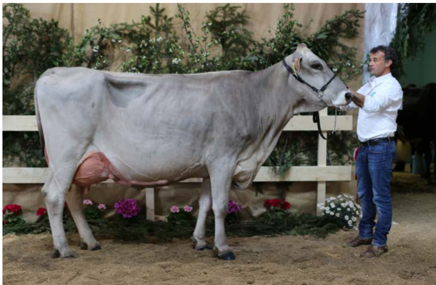
Campionessa riserva vacche brune

La finale delle manze, sintesi di due categorie, ha visto primeggiare Indj Finix (Ventufarm sas) già vincitrice nella categoria manze senior. La riserva assoluta è stata Goldchip 6 Germany di Imana Farm: la maggior forza da latte e un miglior equilibrio sono state le caratteristiche che gli