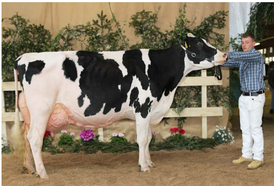
Campionessa delle vacche frisono