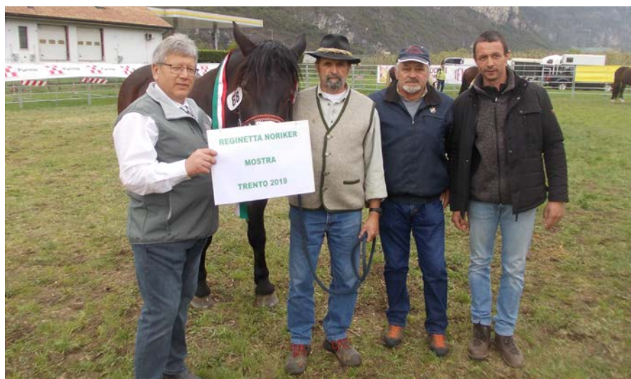
Reginetta del Noriko

Tutte le operazioni si sono svolte con inizio il sabato con una novità: quest'anno i primi soggetti valutati nella mattinata sono stati i Noriker, sia per la numerosità di valutazioni da effettuare, che per dare anche a questa razza la sua visibilità, visti anche i progressi morfologici. I capi da valutare sono stati ben 12 di cui tre bellissimi stalloni: Eron Nero