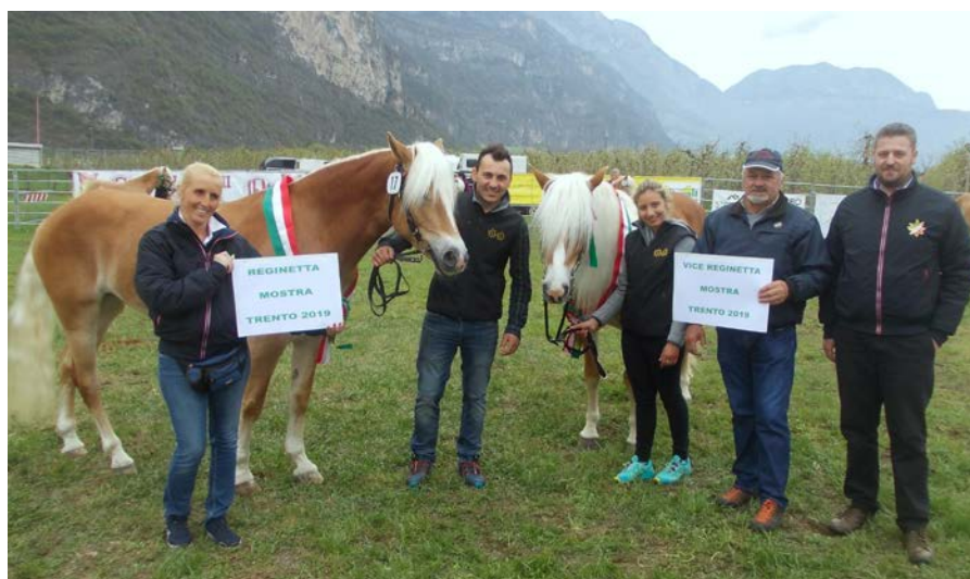
Reginetta e riserva dell'Haflinger

Comunque ci ha pensato il cavallo Noriker a far alzare i numeri delle iscrizioni che vediamo qui di seguito: Haflinger 20 allevatori con 30 soggetti e Noriker 16 allevatori con 31 soggetti.