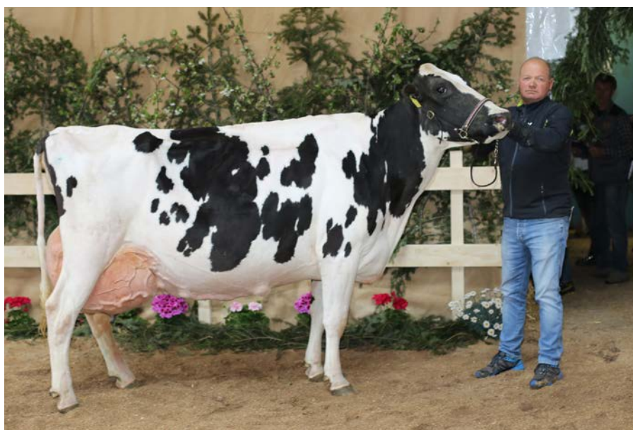
Libera Delta l'ottima frisona con 8 parti all'attivo