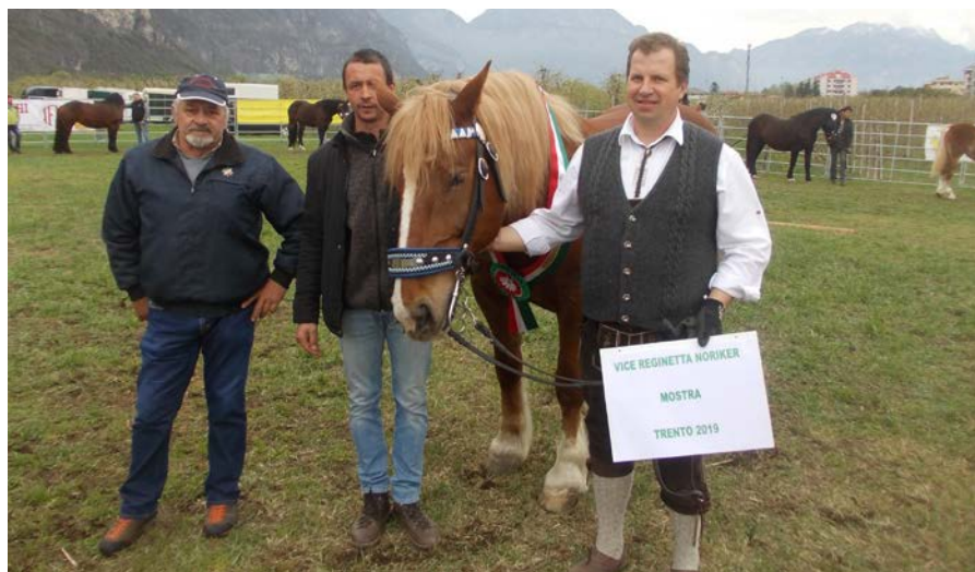
Vice reginetta del Noriko

Ancora un ringraziamento a tutti gli allevatori che come sempre hanno dimostrato veramente grande spirito di squadra, facendo sì che le due giornate della Festa di Primavera non restino solo come pensiero di quei giorni, ma come un bel ricordo almeno fino al prossimo anno.