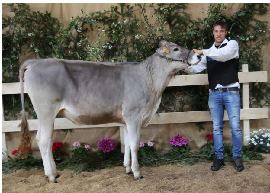
Campionessa delle manze brune

Menzione d'onore: BULMA; Falco; Az. Al Castello di Covi A., A., F. e V.