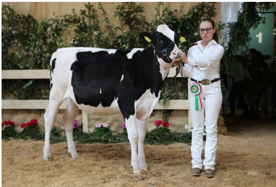
Riserva delle manze frisono