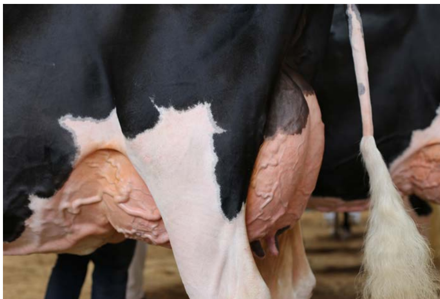
Miglior mammella delle frisone