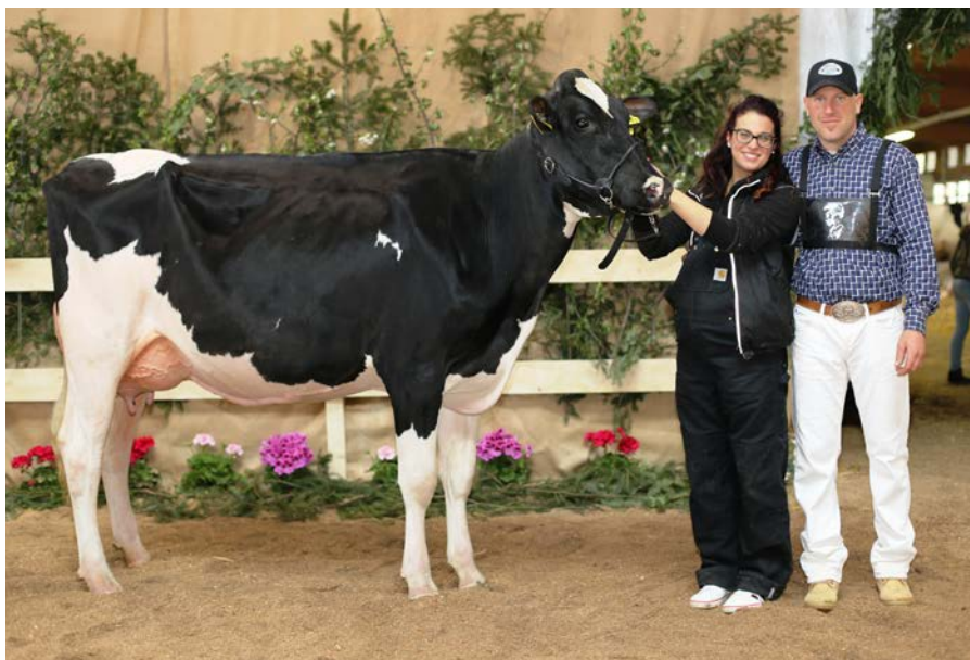
Campionessa riserva vacche frisono