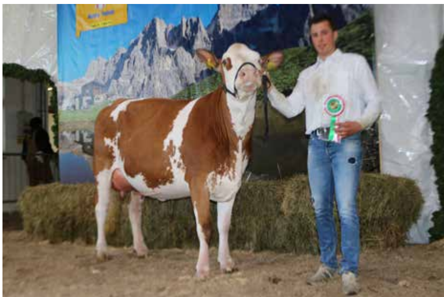
Tulpe campionessa riserva mostra vacche