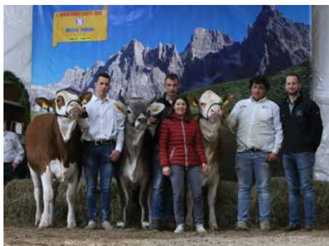
I vincitori della gara di conduzione senior