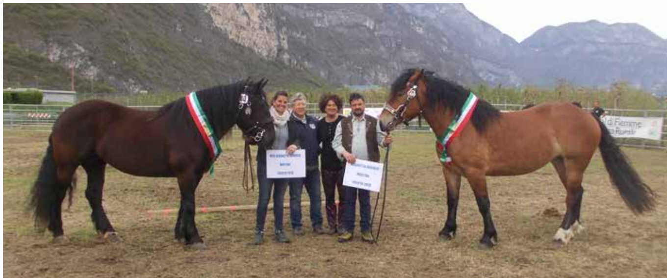
Klava Best in show Noriker e Astrid sua riserva