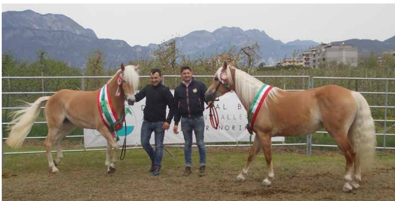
Talina-S Best in show Haflinger e Vivinne di Prabi sua riserva

Verso le 18 gli animali iniziano a tornare a casa, il sole si spegne dietro la montagna, la gente ritorna a casa speriamo con un bel ricordo di queste giornate passate insieme.