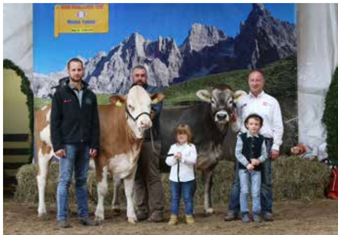
I due più giovani conduttori