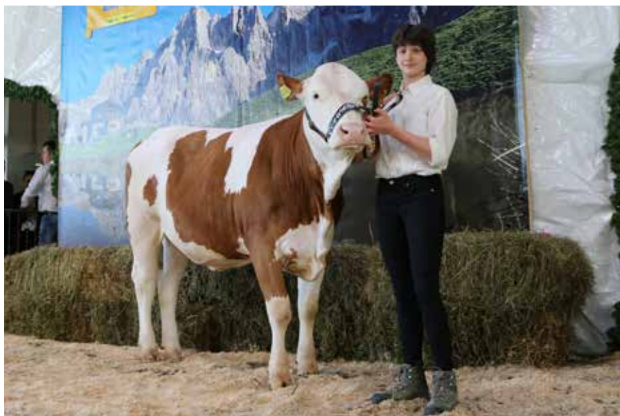
Kessi campionessa riserva manze