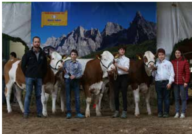
I vincitori della gara di conduzione baby