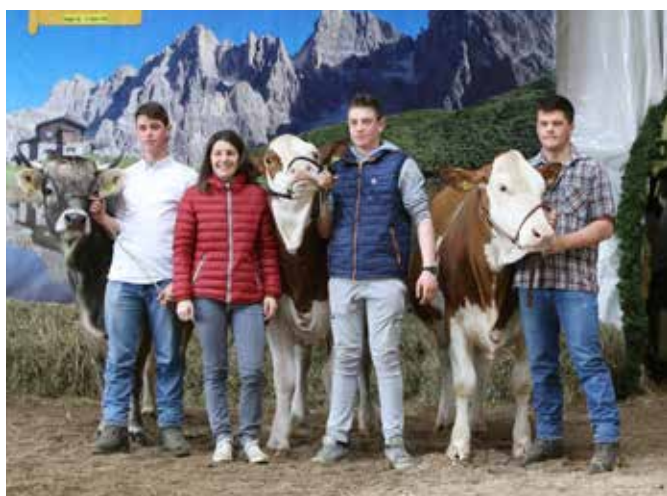
I vincitori della gara di conduzione junior