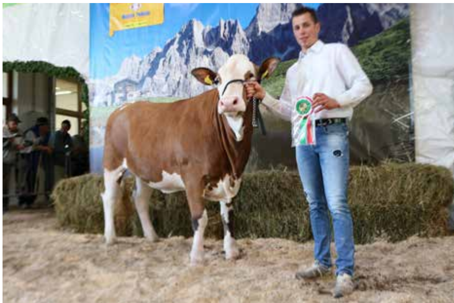
Nannile campionessa mostra manze