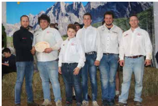
Concorso Giovani di Primavera