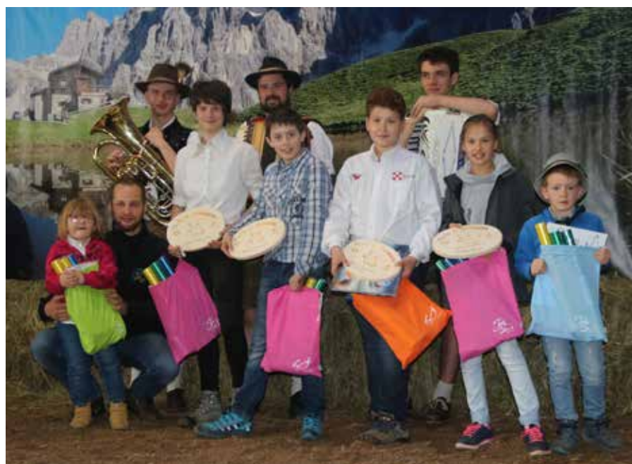
Premiazione di tutti i conduttori baby