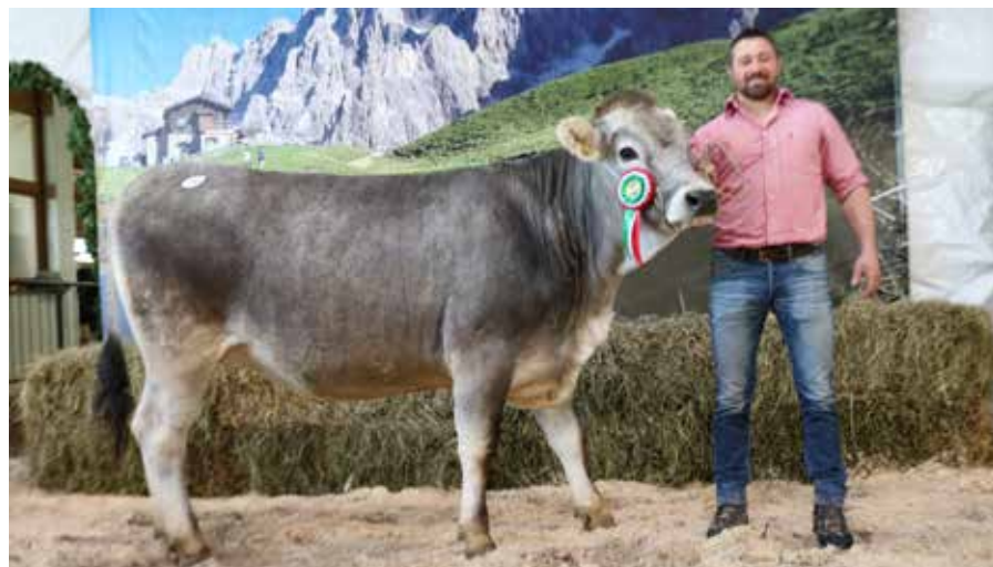
Lolita campionessa riserva manze