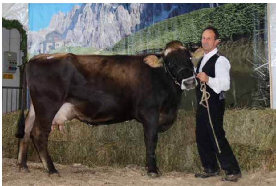
Osciagodan-Beba campionessa riserva e miglior mammella mostra