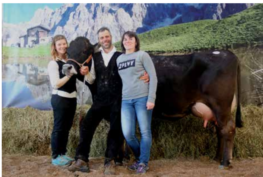
Belen menzione d'onore della mostra