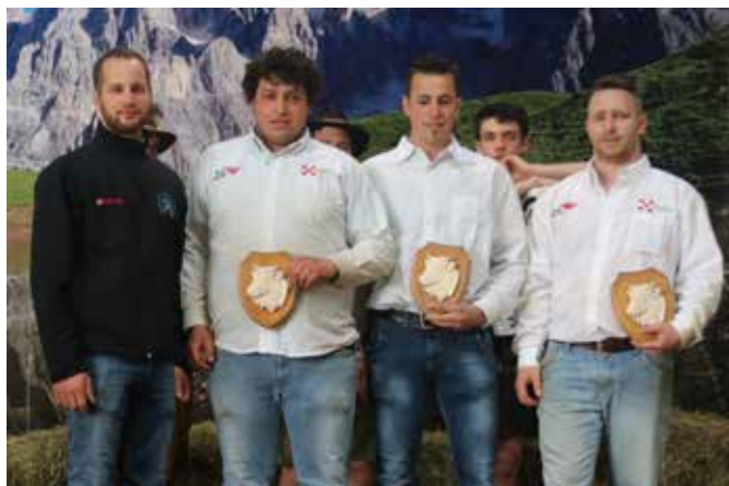
I vincitori della gara di giudizio