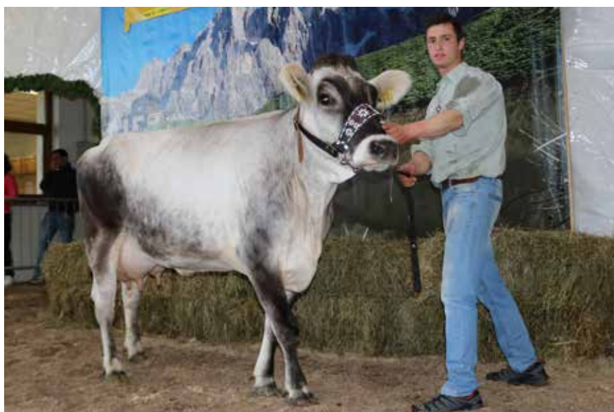
Baffy campionessa riserva e miglior mammella della mostra