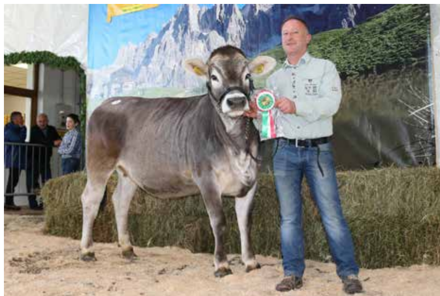
Mara campionessa mostra manze