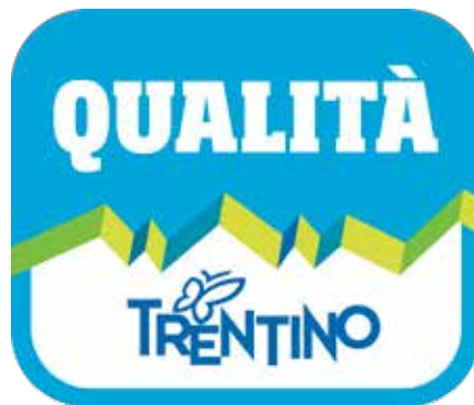
Esempio di marchio MQT

Attualmente si fregiano del marchio Qualità Trentino prodotti come il latte fresco ed i formaggi provenienti dal sistema Latte Trento e Concast, le mele di Melinda e la Trentina, le ciliegie di Sant'Orsola, la susina di Dro con marchio la Trentina, la carne salada di Casa Largher e della macelleria Sighel, lo speck dell'azienda Bomè e i crauti ed altri ortaggi freschi del Consorzio Val di Gresta. A questo si aggiungeranno a breve