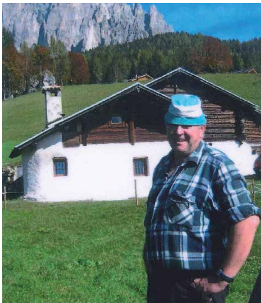
Giovanni Battista Fontana