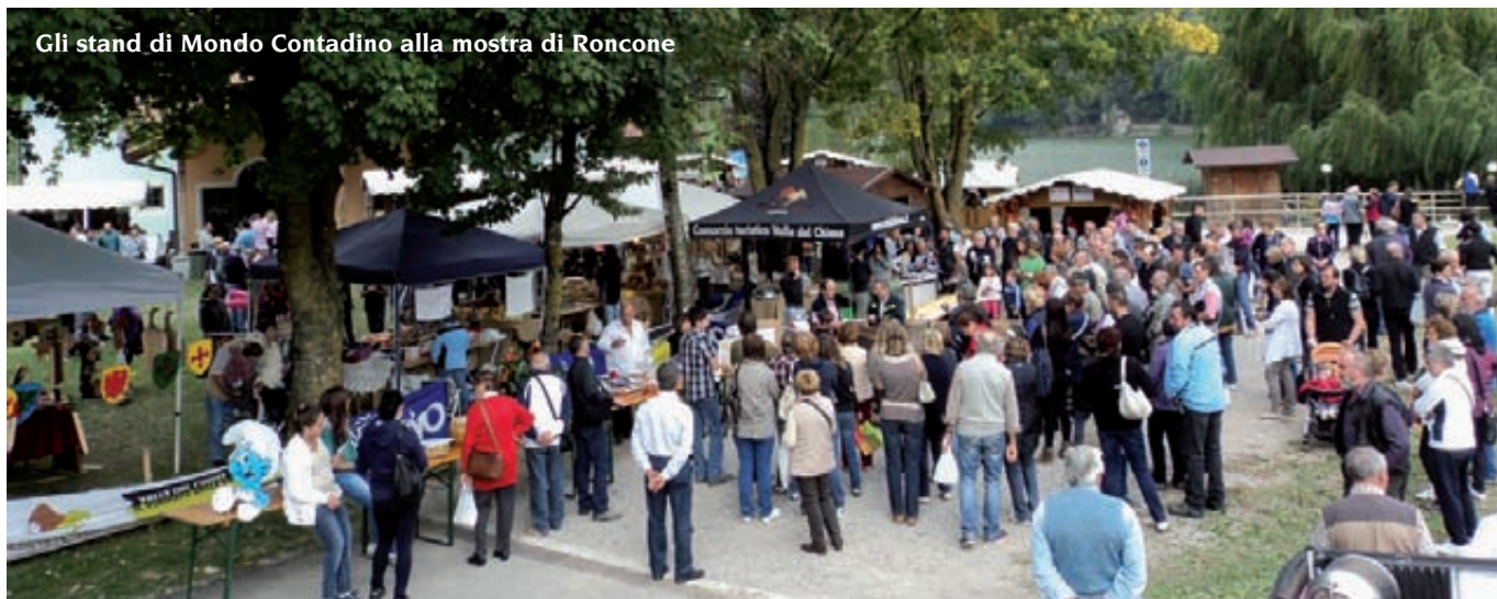
Gli stand di Mondo Contadino alla mostra di Roncone

Da qui sono nate diverse alleanze con le Aziende per il Turismo, le amministrazioni locali e altri soggetti che hanno capito e condiviso la forza di queste manifestazioni. La sfida per gli allevatori è dunque quella di rilanciare continuamente il rapporto con