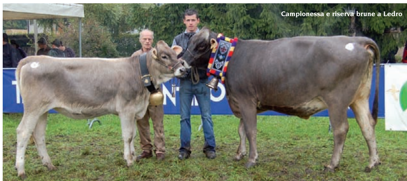
Campionessa e riserva brune a Ledro