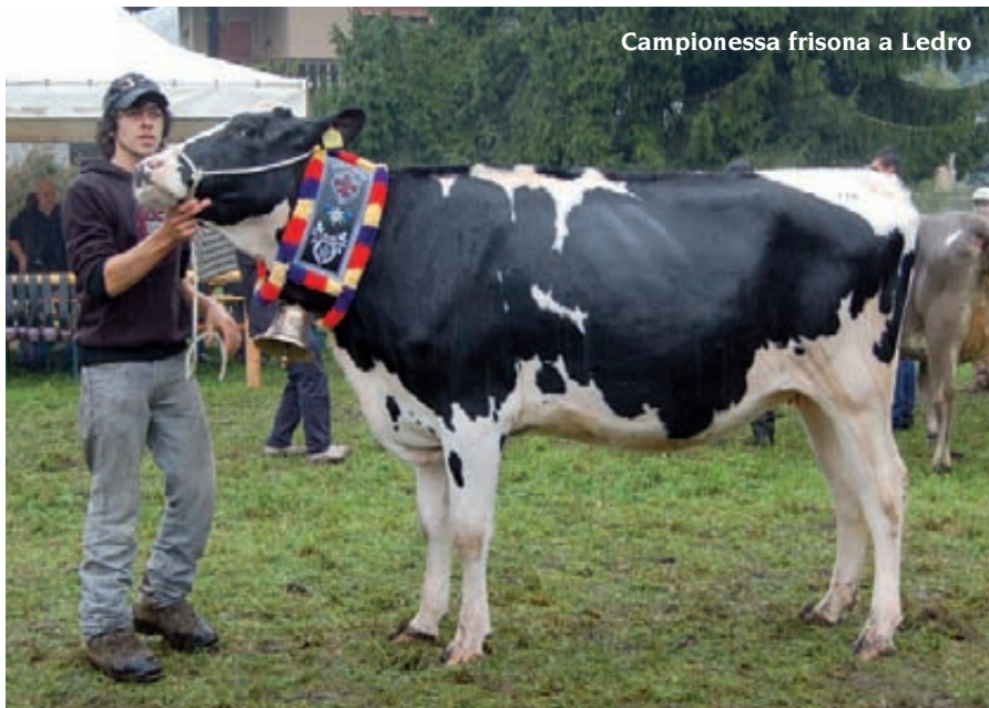
Campionessa frisona a Ledro