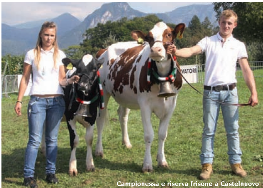
Campionessa e riserva frisone a Castelnuovo