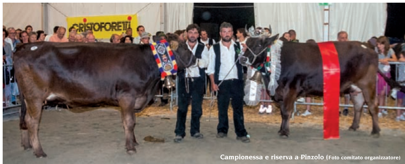
Campionessa e riserva a Pinzolo