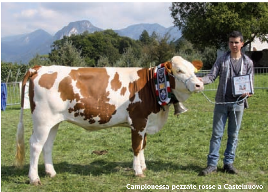
Campionessa pezzate rosse a Castelnuovo