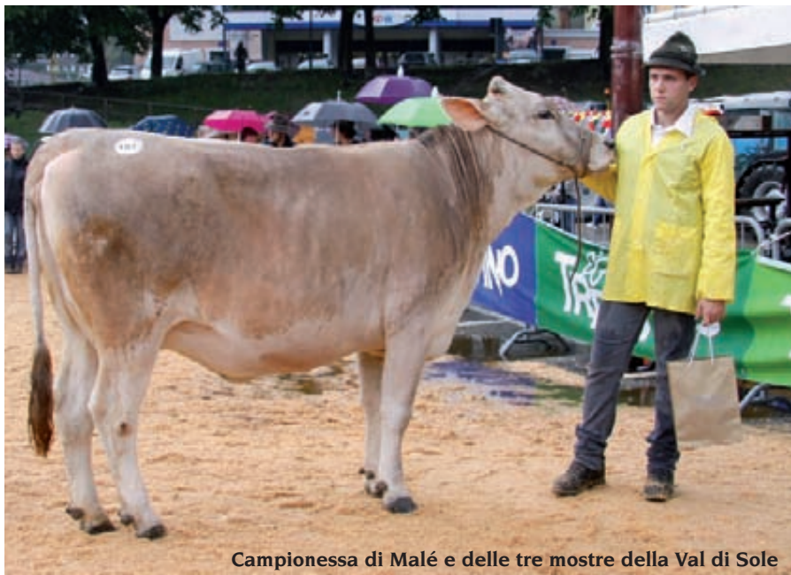
Campionessa di Malé e delle tre mostre della Val di Sole