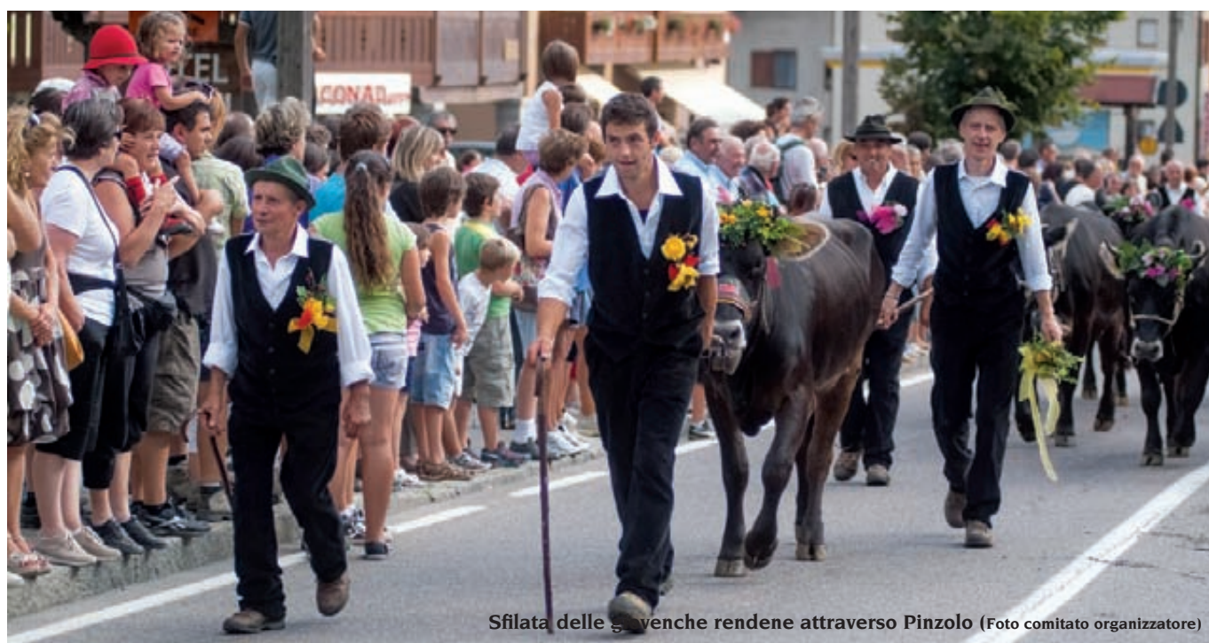
Sfilata delle giovenche rendene attraverso Pinzolo