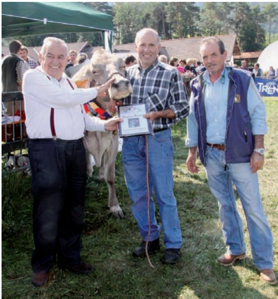
Premiazione della campionessa bruna a Castelnuovo