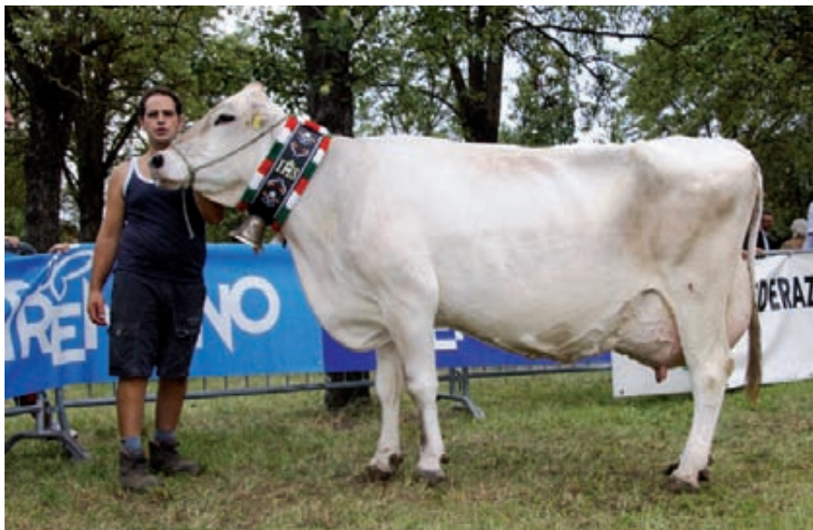
Campionessa vacche brune a Romeno

Riserva: Gioia; Jake; Az. Al Castello di Covi - Fondo