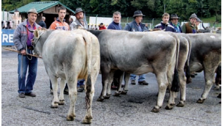
In primo piano la campionessa grigia a Predazzo