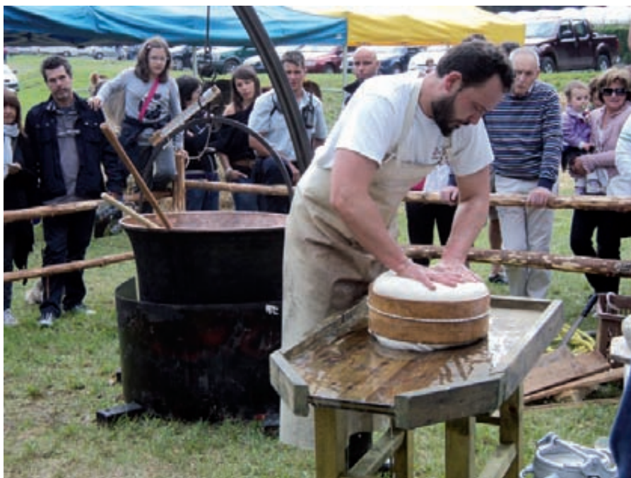
Molto seguite le dimostrazioni di caseificazione

Un altro esempio di visione d'insieme del territorio e di sviluppo partecipato è anche quello rappresentato dalla nostra Fiera di San Michele . A metà degli anni novanta questa manifestazione stava praticamente per sparire in seguito a quella crisi descritta all'inizio dal Presidente Rauzi. Poi è stata ripresa superando i campanilismi e rilanciando il ruolo economico ed ambientale dell'agricoltura di montagna. Alla fiera partecipano sia le razze bovine che il cavallo Haflinger e Norico e sono presenti anche altre produzioni locali ed iniziare dei piccoli frutti. Questa formula ha incontrato il gradimento del pubblico, tanto che dalla tradizionale data del 29 settembre la Fiera è stata spostata all'ultimo sabato di