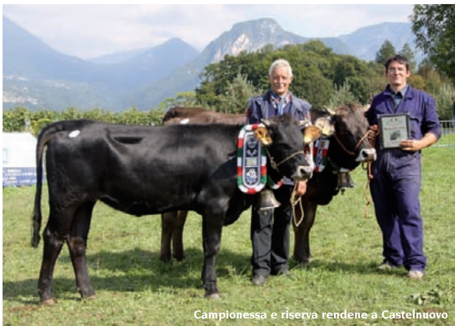
Campionessa e riserva rendene a Castelnuovo